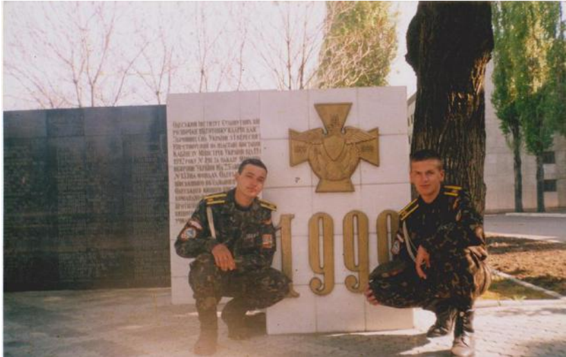
Під час навчання в Одеському військовому інституті