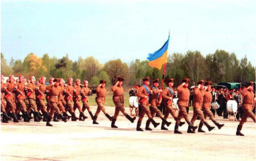
Підготовка до параду, 2005 р.