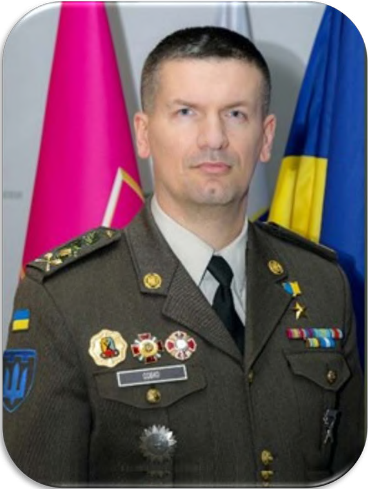
Герой України Сергій СОБКО