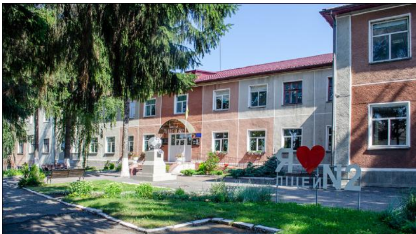
Літинська школа-лицей №2