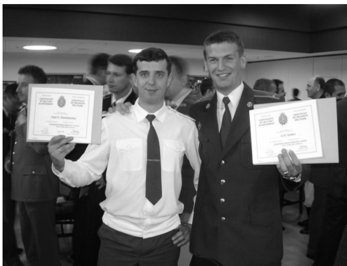
Праворуч, під час навчання у Канаді

(військова база Гоенфельс, Німеччина, 2009) та підвищений 9-місячний курс офіцерів піхоти з організації і тактики ведення бою (Форт Беннінг, штат Джорджія, США); отримав від громади Новоград-Волинського диплом «Гордість міста – 2013» у номінації «Військова доблесть». 2014-го успішно склав тести і його зарахували на навчання в один з найстаріших вищих навчальних закладів армії США – Командно-штабний коледж армії США у штаті Канзас. Вже мав їхати на навчання, але почалися бойові дії на Донбасі).