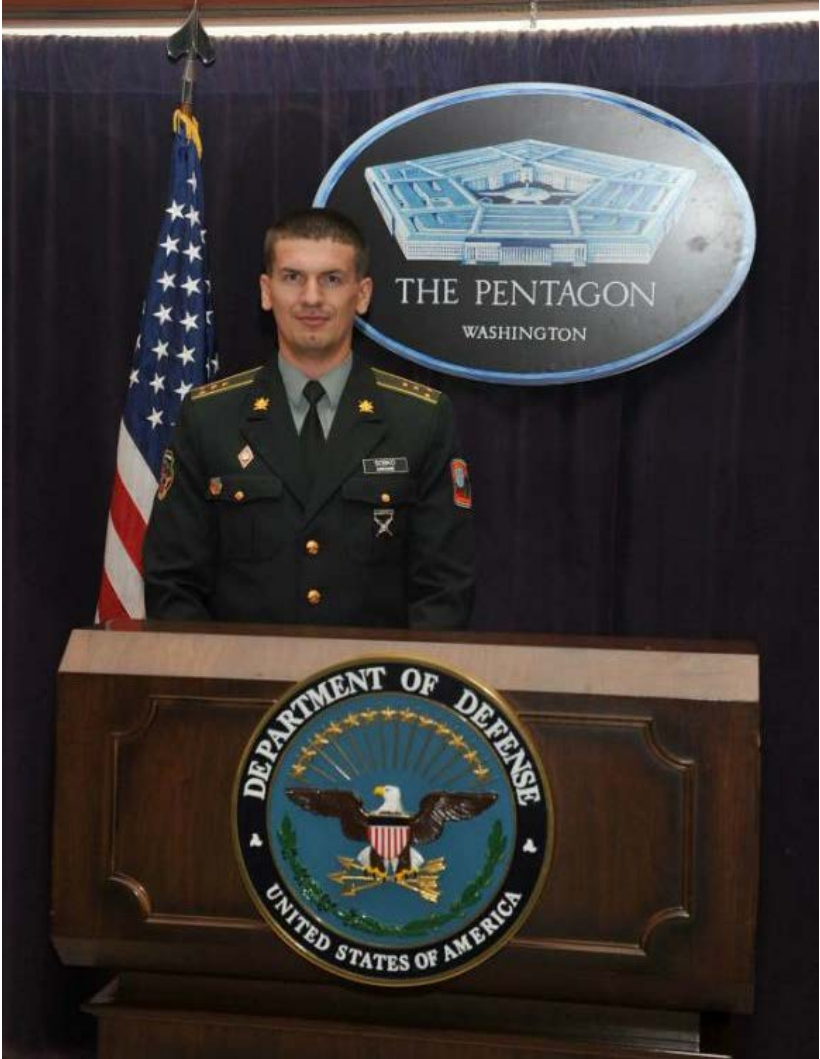
Під час навчання у США