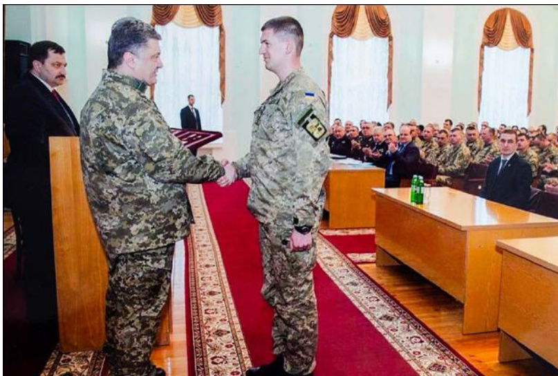
Президент України Петро Порошенко вручає Сергію Собку Золоту Зірку Героя України