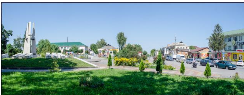
Панорама центру Літина і меморіалу Слави Героїв минулої війни