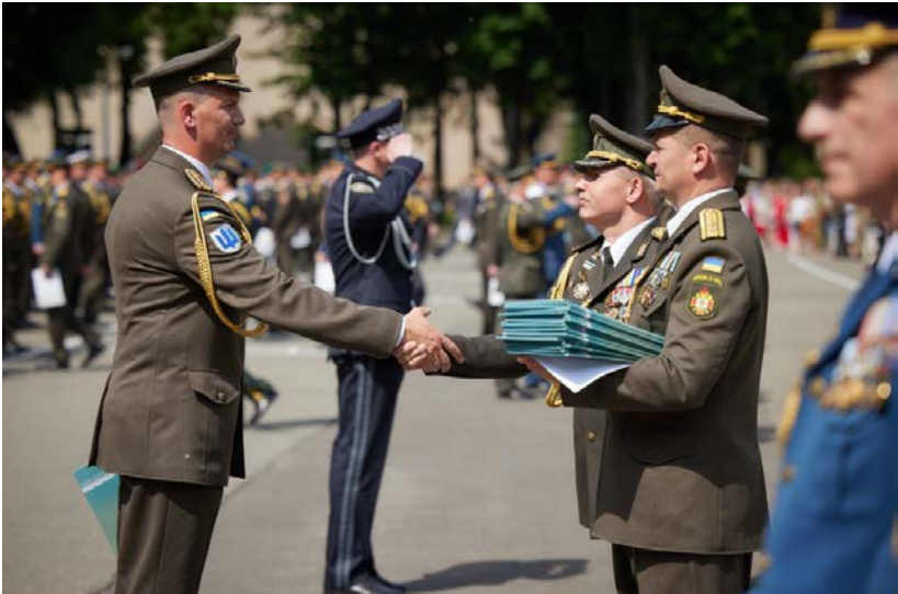
Під час випуску