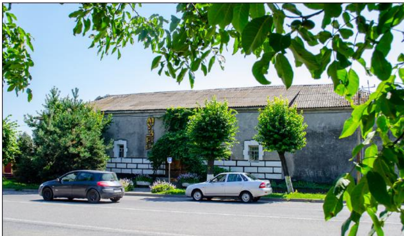
Літинський музей, колись – в'язниця, звідки утік Устим Кармелюк