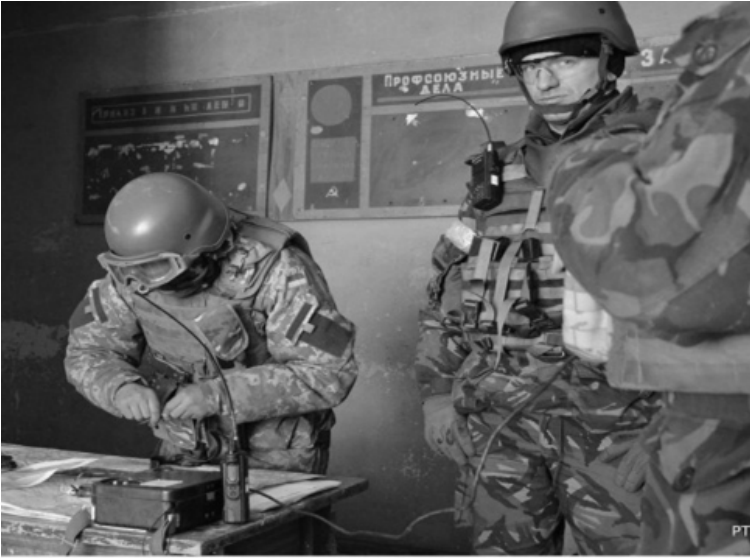
На Дебальцевському плацдармі