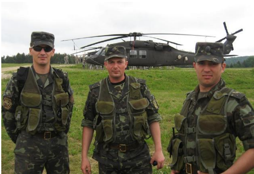
Миротворча місія в Косово