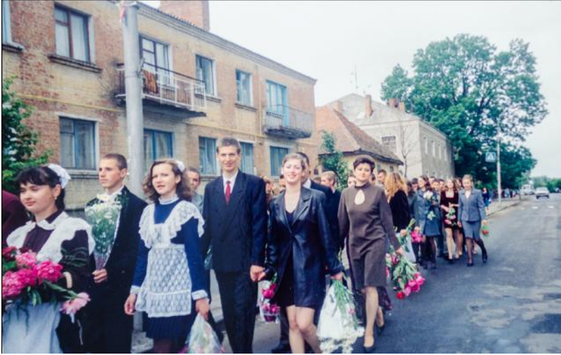
З однокласниками на святі