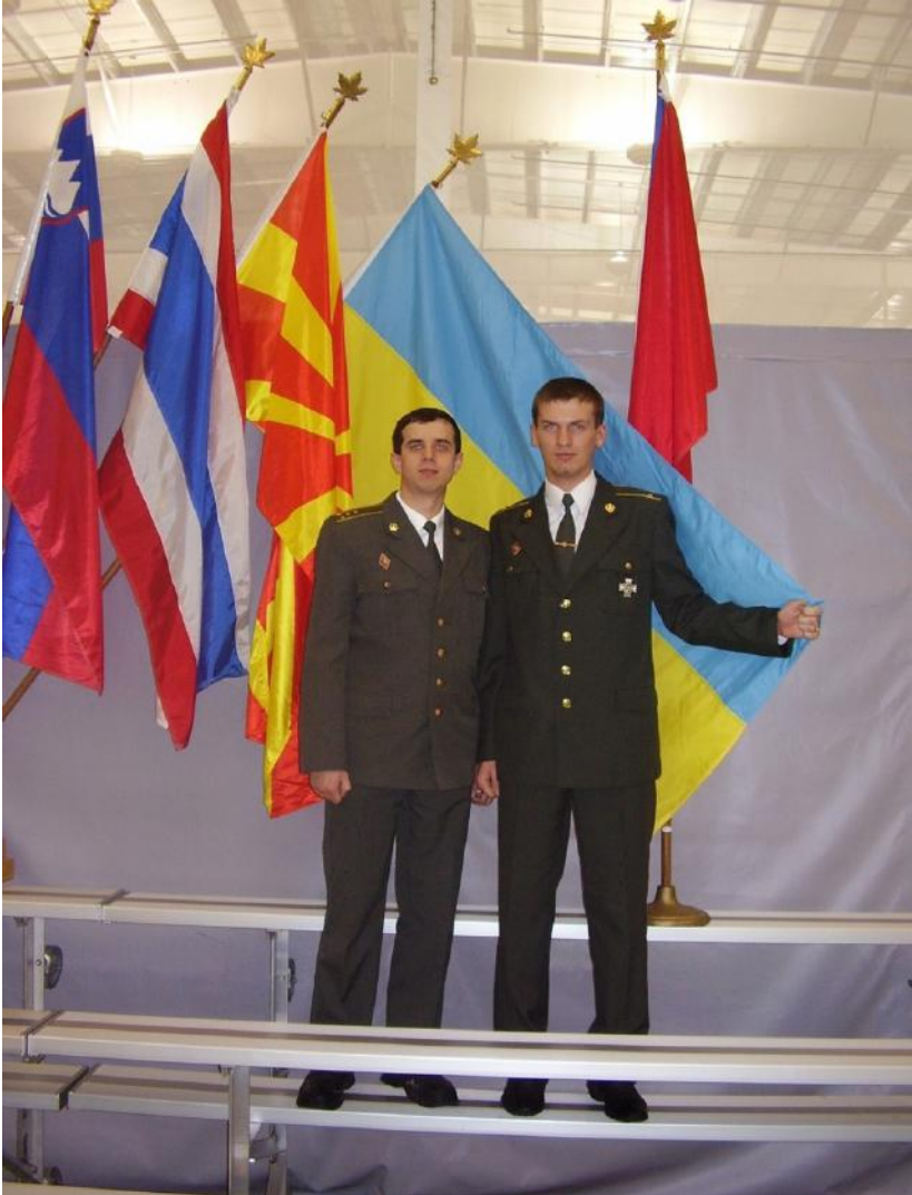
Під час навчання у Канаді