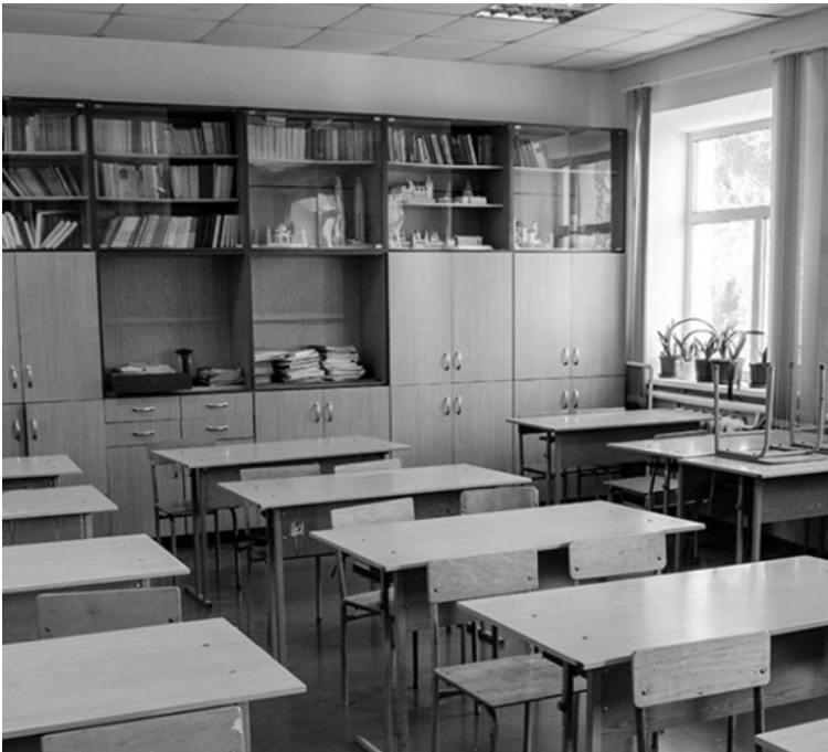
Клас, де навчався майбутній Герой України