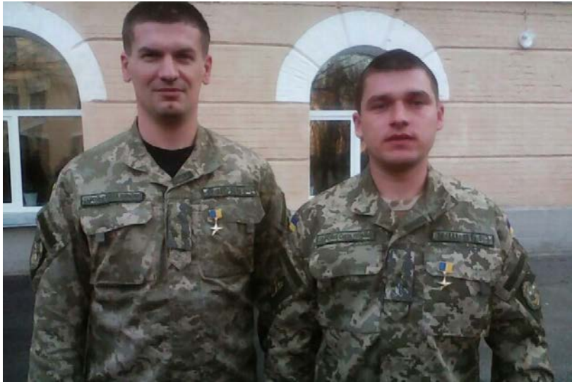
Герої України Сергій Собко і Володимир Гринюк