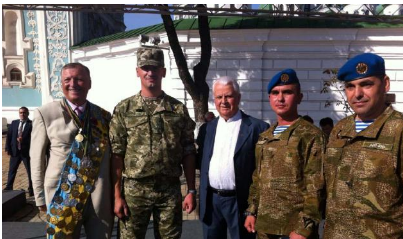
З Президентом України Леонідом Кравчуком, у День Прапора, 2015 р.