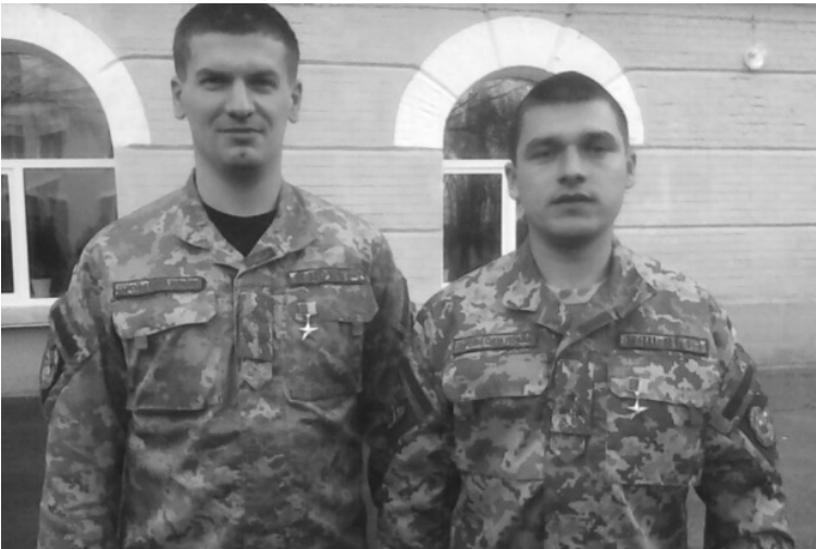
Герої України Сергій Собко і Володимир Гринюк