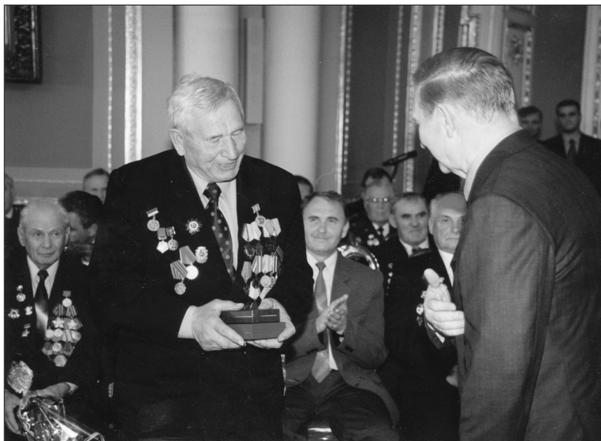
Президент України Леонід Кучма вручає Івану Цурканю державні нагороди. Маріїнський палац, 2000 рік.

Я знав і знаю багато гарних людей, які навчили мене жити. Це головне. Людина існує не сама собою і не сама в собі. Вона існує в інших людях, і навпаки — інші люди існують в ній. У цьому плані мені дуже повезло. Найперше місце серед людей мого життя займають батько й мати. Батько учився в школі лише два місяці, був мало освіченим: але самотужки він в якійсь мірі і працював завідуючим складом нафтопродуктів, і бригадиром рільничої бригади, і на інших роботах. Пам'ятаю, неодноразово, сидимо ми довгими зимовими вечорами і вирішуємо шкільні задачі, то він по пам'яті додає і віднімає трьохзначні цифри. Був дуже розсудливий, мав багато друзів.