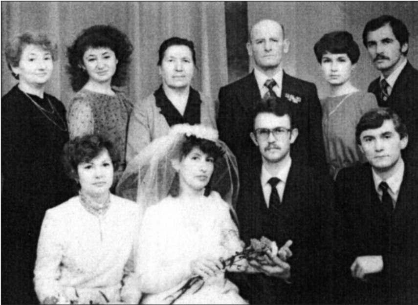
Зростає рід Шимкових.

засідали комбіді (комітет бідноти) разом із НКВД і головою сільради. Вони вирішували всі справи на селі, селян тримали в страхові, особливо тих, хто хоч трохи був заможний. Коли тато приходив додому я ніколи не чув. По цілих ночах тато, і багато таких як він, просиджували, слухаючи мораль людську і вироки, рішення комісії бідноти і НКВД. Тато рано розповідав мамі кого вирішили розкуркулити і після таких розповідей в хаті було мовчазно та тільки чути важке дихання. Дороги в селі заметені снігами враз із загорожами, їх ніхто не прочищав — були стежки на вулиці, сніг влягався.